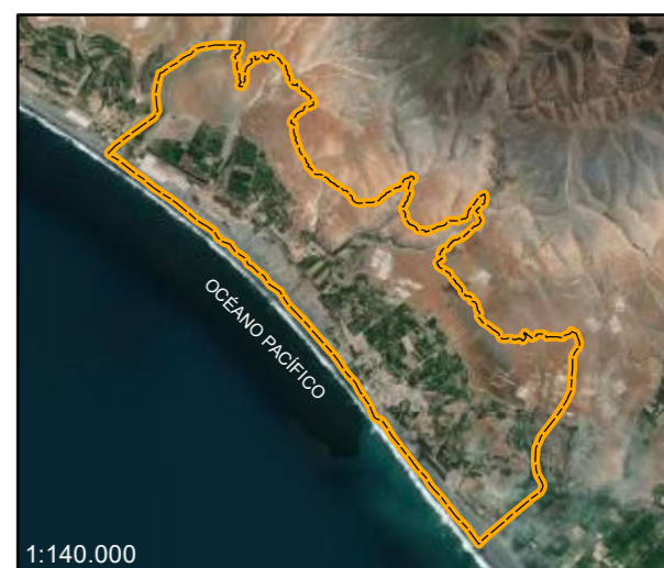
ÁMBITO DE INTERVENCIÓN