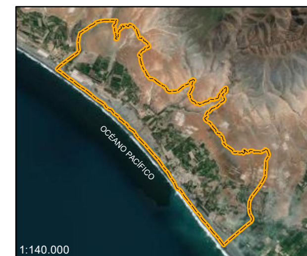
ÁMBITO DE INTERVENCIÓN